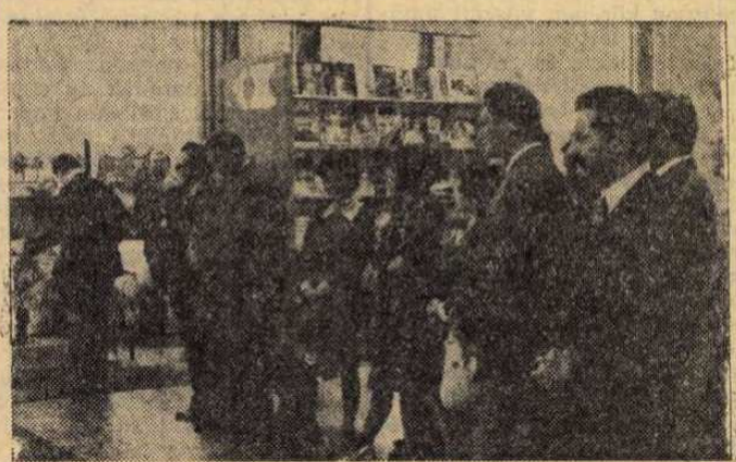
A Szovjet Sajtó Napján, május 5-én nyílt meg a Postás Művelődési Központban a „30 éve szabad magyar sajtó” kiállítás, a három évtized alatt hazánkban megjelent hír- és szaklapok anyagából.

Az elmúlt hetek magyar diplomáciai eseményei között tallózza a legjelentősebb történések sorában kell megemlíteni, hogy Sarlós István , az MSZMP KB Politikai Bizottságának tagja, a Hazafias Népfőrdő Országos Tanácsának elnöke vezetésével magyar párt- és kormányküldöttség utazott Moszkvába, a Győzelem Napjának ünnepségeire. Lázár György miniszterelnök-helyettes vett részt hazánk megbízásából Moszkvában a KGST végrehajtó bizottságának ülésén. Külügyminiszterünk, Puja Frigyes Egyiptomban látogatott és ott vezetett államférfiakkal. Szadat elnökkel is tárgyalt, Schulzeis Emil egészségügyi miniszter Moszkvában járt. Hazánkba látogatott sok más vendég mellett Ahti Karjalainen finn külügyminiszter, K. B. Andersen dán külügyminiszter, Nikola Kmezić , a jugoszláv vaddiszi szocialista autonóm tartomány végrehajtó bizottságának elnöke és Szaddám Huszein , az Iraki Köztársaság forradalmi parancsnoki tanácsának elnöke.