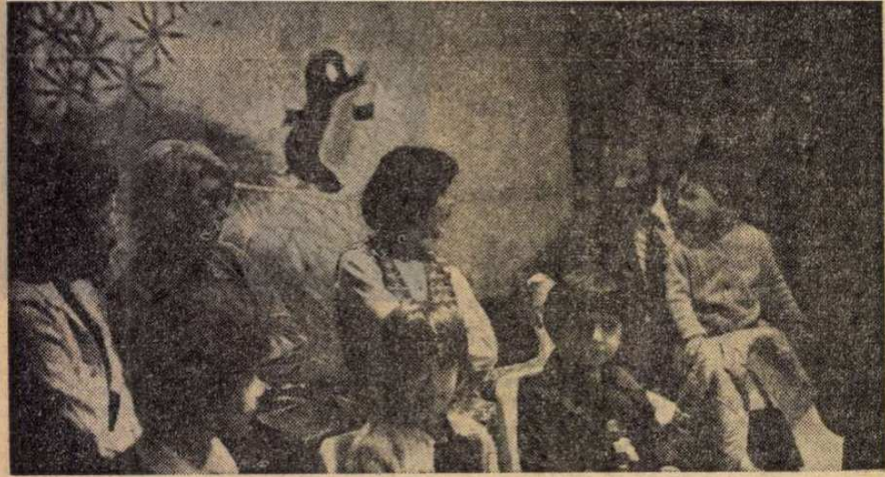
Ezután minden hónap elején gyermekmatiné lesz

ják a fiatalok saját életüket. Még egy új született ezen a napon: megalakult a „Klubok közötti klub”, a „Fókusz”. Ez a MAHART, MRT, a Divatfórássz Szövetkezet és a postás szervezetek klubjait fogja össze. Úgy tervezik, hogy közös tagsági igazolványt és közös programfüzetet adnak ki. A programok megszervezésében is segítik egymást. Olyan előadókat, művészeket hívnak meg, akik közvetlen hangulatot teremtve, felejthetetlen élményt nyújtanak hallgatóiknak.