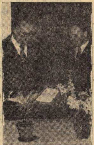
Balatonszabadiiban, az élüzemünnepségen